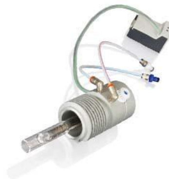
Módulo para líquidos*