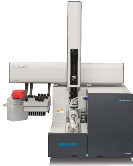
Configuración: XPLORER con ARCHIE*