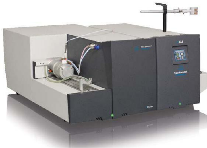
Configuración: XPLORER con GLS*